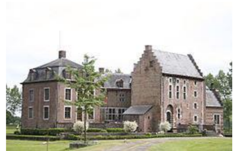
Het kasteel van Loye werd opgetrokken in het jaar 1429.